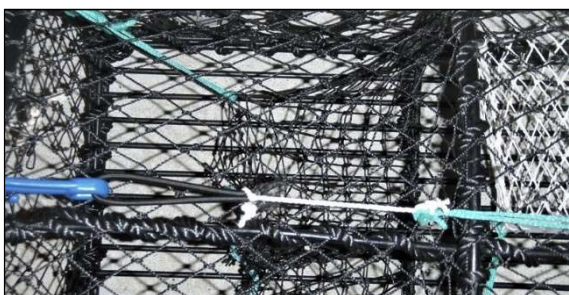
Figur 2. Bomullstråd mellom strikk og låsekrok.