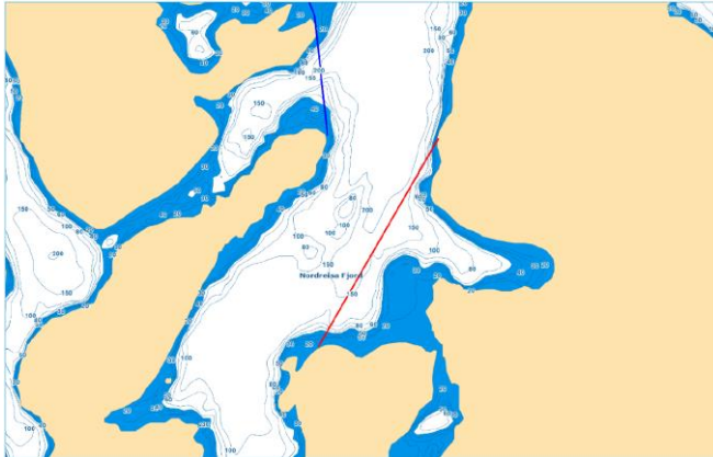
Figur 1: Oversiktskart for stengt område på Reisaffjorden i Troms per 10.12.2018

Det ble foretatt en stengning i sildefisket høsten 2018, se figur 1. Stengningen ble foretatt på bakgrunn av stor innblanding av sild under minstemål.