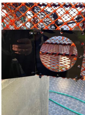
Figur 1. T.v. Skisse av lukeløsning som rømmingshull. T.h. Eksempel på innmontert lukeløsning med hengsel til venstre.