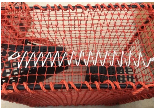
Figur 2. Snittet sys (lisses) sammen med bomullstråd.