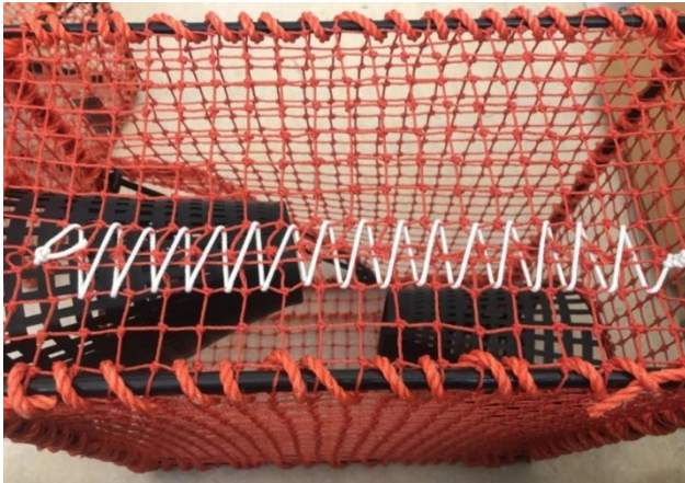
Figur 2. Snittet sys (lisses) sammen med bomullstråd.