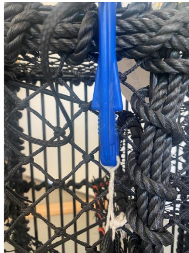
Figur 3. T.v. Låsekroken hukes i løkke av bomullstråd. T.h. Bomullstråd mellom strikk og krok.