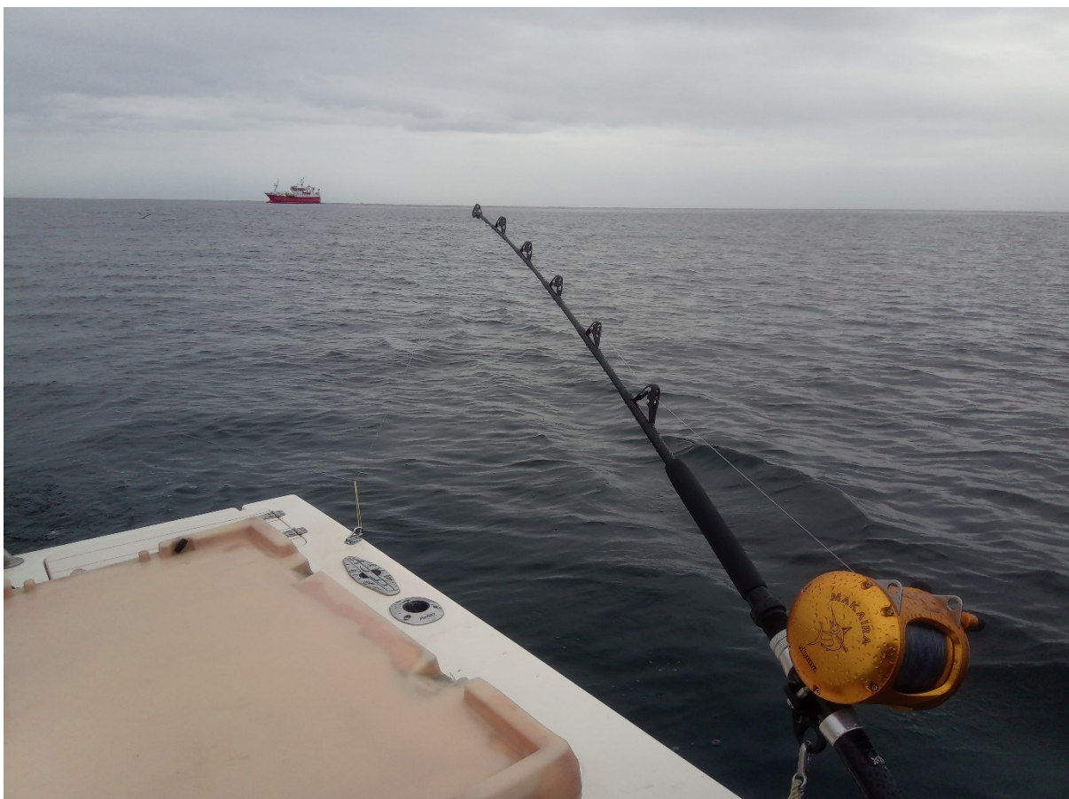
Fiske fra merk- og slippfiskelag med Orfjord som kaster på makrellstørje i horisonten.

Den norske kvoten av makrellstørje for 2019 var på 239 tonn. Fire fartøy som fisket med line og fire fartøy som fisket med not deltok i fisket. Alle linefartøyene var under 15 meter, mens tre av notfartøyene var under 40 meter og ett var over 40 meter. I tillegg deltok fire merk- og slippfiskefartøy i merkefisket etter makrellstørje. De tre notfartøyene under 40 meter fikk tildelt en fartøykvote på 45 tonn, mens notfartøyet over 40 meter fikk tildelt en kvote på 52 tonn. De fire linefartøyene fikk tildelt en kvote på 6 tonn hver. 27 tonn ble satt av til bifangst av makrellstørje i fisket etter andre arter. Det ble avsatt ett tonn til død og døende makrellstørje i merk- og slippfisket.